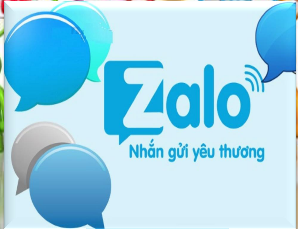
Sử dụng mạng zalo