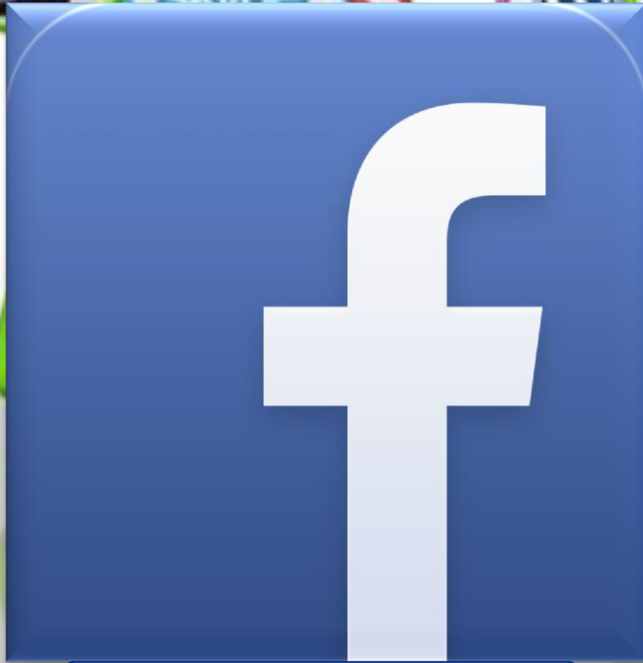
Sử dụng mạng facebook