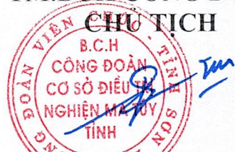
Phùng Đức Sơn