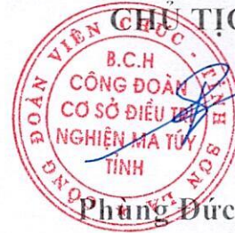
Phùng Đức Sơn