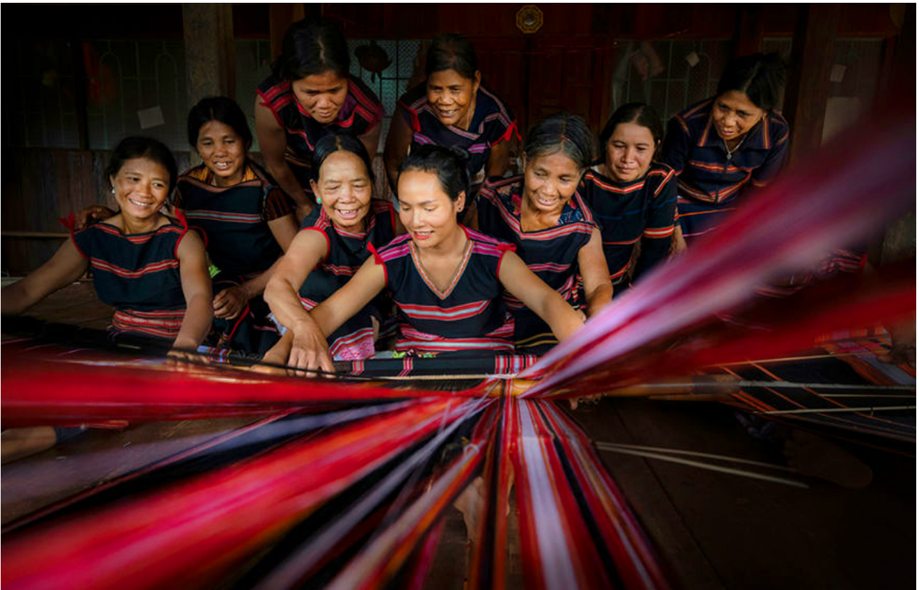
Trao truyền các giá trị văn hóa cho thế hệ mai sau_

Như vậy, phát triển nâng tầm văn hóa dân tộc Việt Nam lên ngang tầm thời đại là một tư tưởng vô cùng đẹp đẽ, sâu sắc và cao rộng của Chủ tịch Hồ Chí Minh với vai trò là người đứng đầu của một quốc gia - dân tộc; hơn thế, là đại diện về tư tưởng, trí tuệ, tinh thần, hồn cốt của quốc gia - dân tộc Việt Nam. Những quan điểm, tư tưởng của Người về văn hóa, phát triển, nâng tầm văn hóa dân tộc không chỉ có ý nghĩa quan trọng trong thời kỳ cách mạng dân tộc dân chủ, mà còn có giá trị sâu sắc trong công cuộc xây dựng chủ nghĩa xã hội. Những tư tưởng ấy chính là cơ sở, nền tảng cho Đảng xây dựng đường lối phát triển nền văn hóa Việt Nam tiên tiến, đậm đà bản sắc dân tộc trong giai đoạn hiện nay với các định hướng cơ bản, như xây dựng hệ giá trị văn hóa và chuẩn mực con người gắn với giữ gìn, phát triển hệ giá trị gia đình Việt Nam; xây dựng con người Việt Nam thời đại mới, gắn kết chặt chẽ, hài hòa giữa giá trị truyền thống và giá trị hiện đại; xây dựng môi trường văn hóa thật sự trong sạch, lành mạnh, cải thiện điều kiện thụ hưởng văn hóa của nhân dân; bảo vệ và phát huy các giá trị tốt đẹp, bền vững trong truyền thống văn hóa Việt Nam; gắn việc giữ gìn và phát huy các giá trị văn hóa truyền thống Việt Nam với việc chủ động, tích cực hội nhập quốc tế về văn hóa, xây dựng Việt Nam thành địa chỉ hấp dẫn về giao lưu văn hóa quốc tế; tiếp thu có chọn lọc tinh hoa văn hóa nhân loại phù hợp với thực tiễn Việt Nam, từng bước đưa văn hóa Việt Nam đến với thế giới;... (18) ./