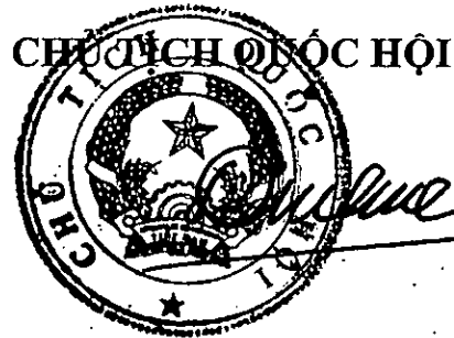
Vương Đình Huệ

Nghị quyết này được Quốc hội nước Cộng hòa xã hội chủ nghĩa Việt Nam khóa XV, kỳ họp bất thường lần thứ 5 thông qua ngày 18 tháng 01 năm 2024.